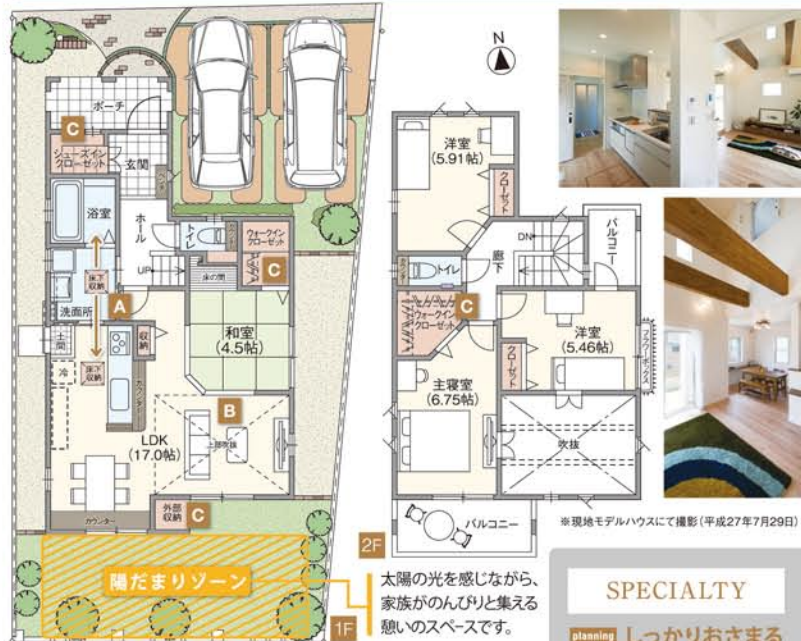
※現地モデルハウスにて撮影(平成27年7月29日)

■敷地面積: 147.84㎡ □1F床面積: 56.10㎡ ■延床面積: 98.74㎡ □2F床面積: 42.64㎡